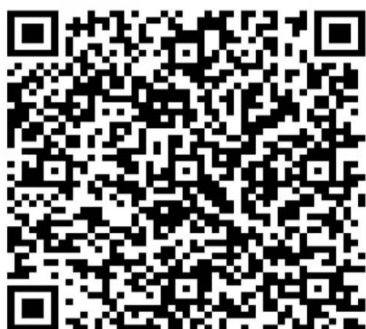
桂林市中医医院调剂复试通知微信群