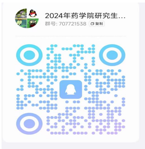
药学院调剂复试通知 QQ 群