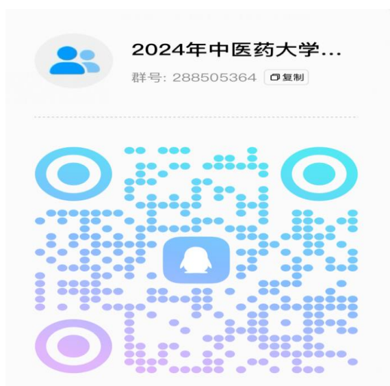
广西壮族自治区人民医院调剂复试通知 QQ 群