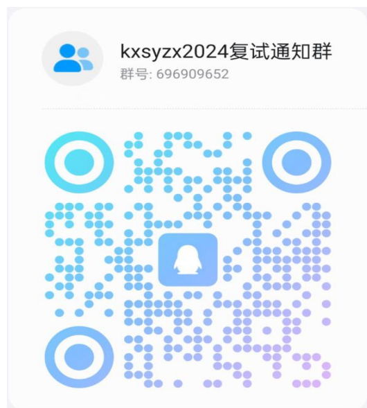
科学实验中心调剂复试通知 QQ 群