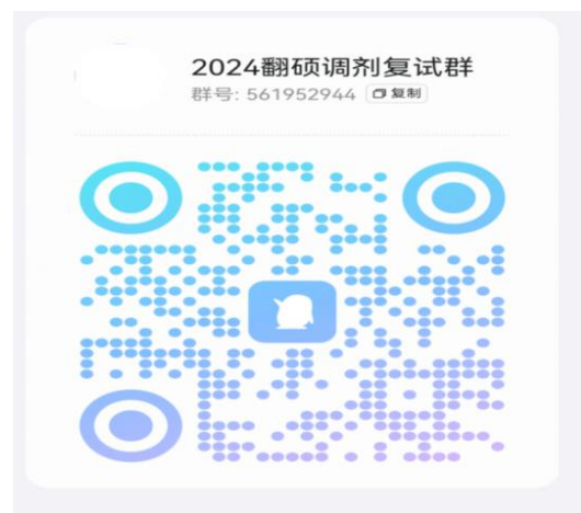
外语部调剂复试通知 QQ 群