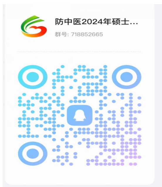
防城港市中医医院调剂复试通知 QQ 群