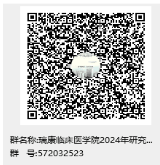
瑞康临床医学院调剂复试通知 QQ 群