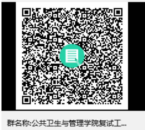
公共卫生与管理学院调剂复试通知 QQ 群