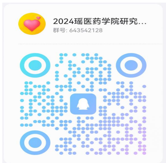
瑶医药学院调剂复试通知 QQ 群