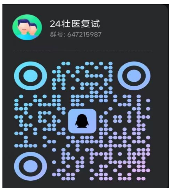
壮医药学院调剂复试通知 QQ 群

为了保证硕士研究生招生调剂复试工作进行顺利进行，便于学院与考生联系，现将各学院调剂复试通知群公布如下，请考生查看本人复试学院通知群二维码，并扫码入群。