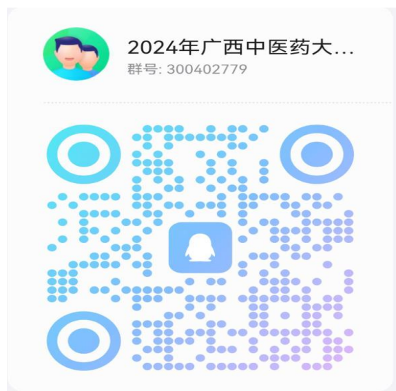
第一临床医学院调剂复试通知 QQ 群