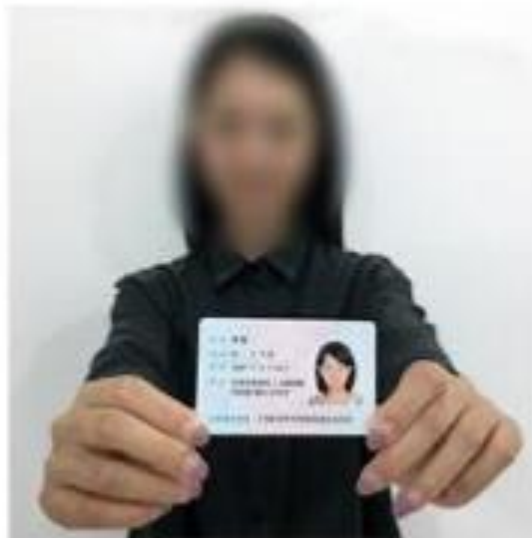
(手持身份证照片示例)

照片要求：拍摄时，将持证的手臂和上半身整个拍进照片，头部和肩部要端正，头发不得遮挡脸部或造成阴影，要露出五官确保身份证上的所有信息可见、完整。建议大小不超过 5M。