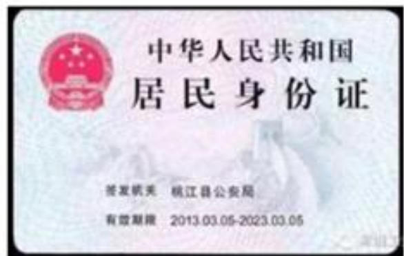
(身份证正反面示例)