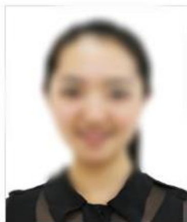
(证件照标准示例照片)

翻拍，不得用修图软件更换照片背景颜色 )。该照片将用于初试准考证、学信网录取登记表等重要材料照片和考生身份验证，考生务必慎重对待。