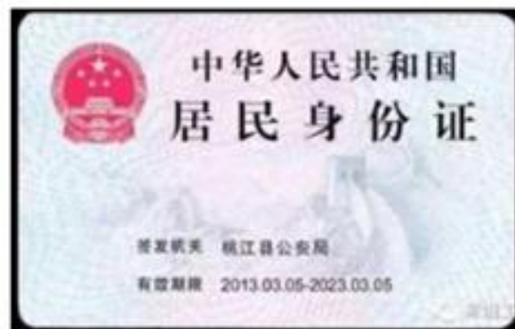
(身份证正反面示例)